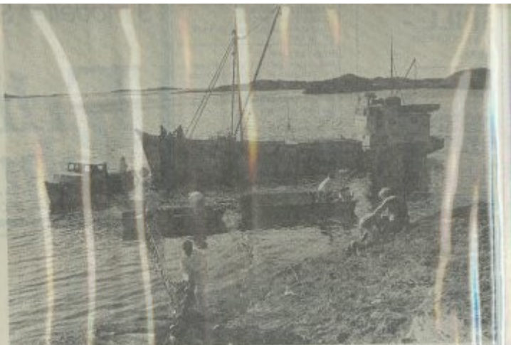
Snakka og dei to robåtene ved landnota, medan føringsbåten «Trikken» håvør inn fangsten.